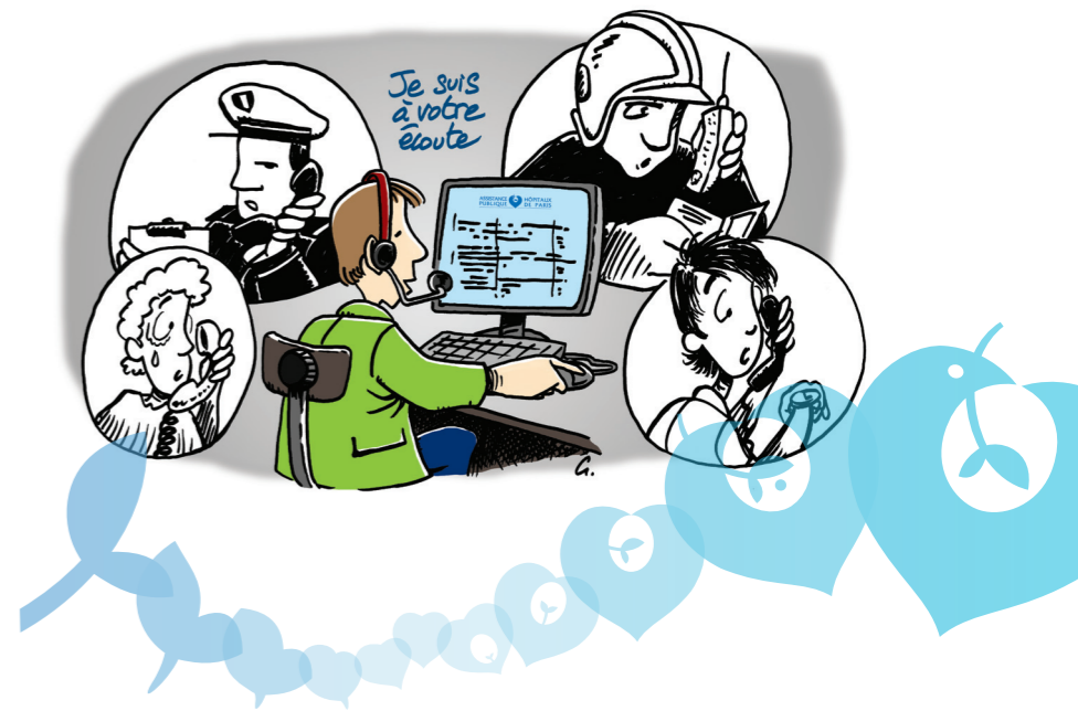
© 2012 - AP-HP - DSPC/Agence de communication interne et patients - Studio graphique ; illustration de couverture Gérard Braïda